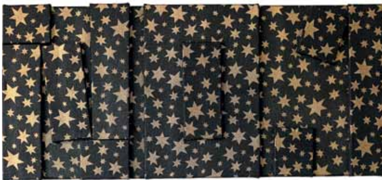
No. 1 or No One , 2013 Stretched textile 50 x 100 cm