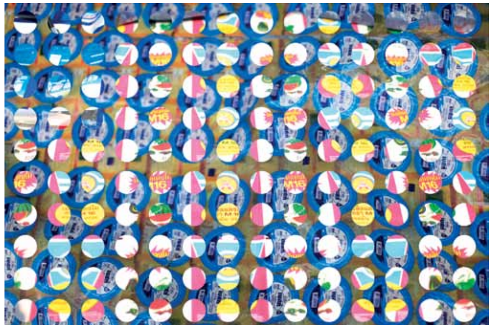
Selling Points, 2014 Composition on a sticker page 22 x 26 cm