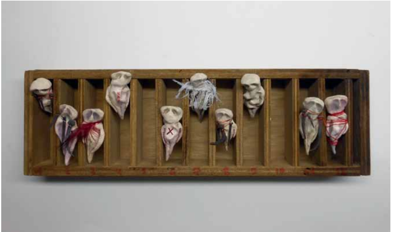
Untitled, 2012 Ceramics antique nails, gold leaf, wax 12 x 12 x 10 cm