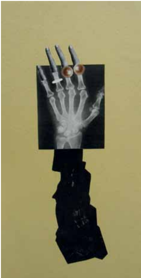
Untitled, 2012 Collage 28 x 13 cm