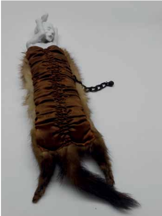
Untitled, 2014 Ceramics, wax, fabric, fur 7 x 5 x 12 cm