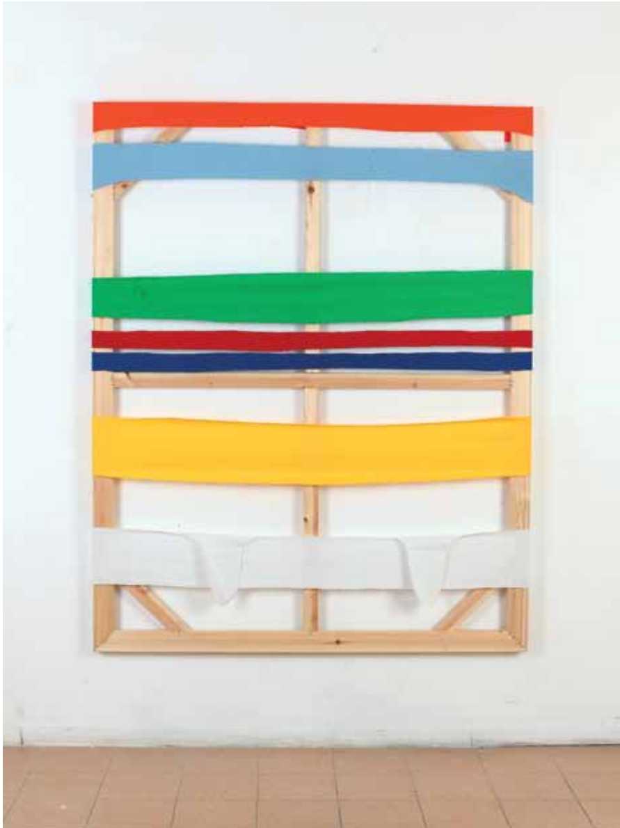
Striptease , 2012 Stretched fabrics on stretcher 150 x 120 cm