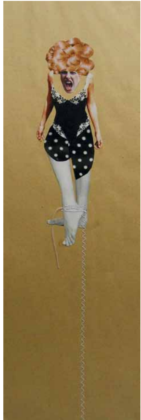
Untitled, 2012 Collage 41 x 13 cm