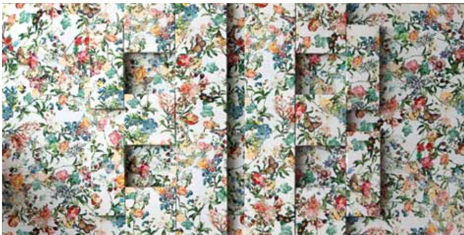
Bareback , 2014 Stretched textile 70 x 140 cm