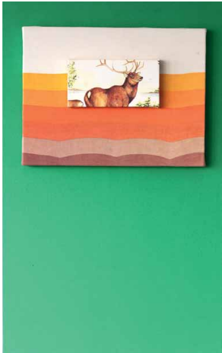
Untitled , 2013 Stretched textile 80 x 50 cm