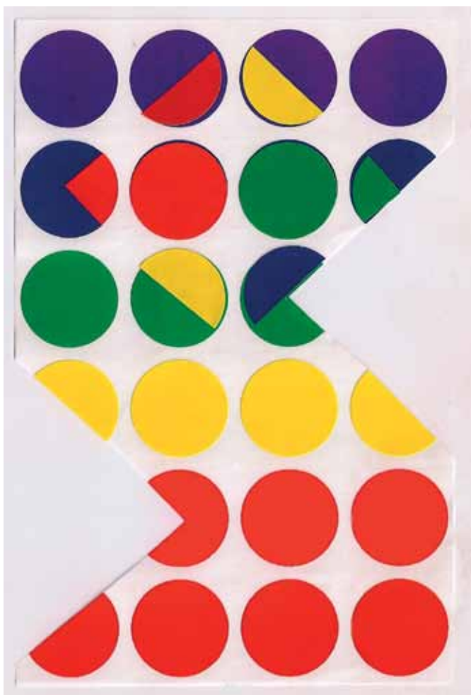
Selling Points , 2011 Composition on a sticker page 28 x 22 cm