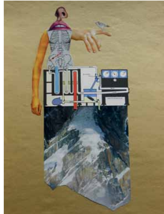
Untitled, 2012 Collage 27 x 24 cm