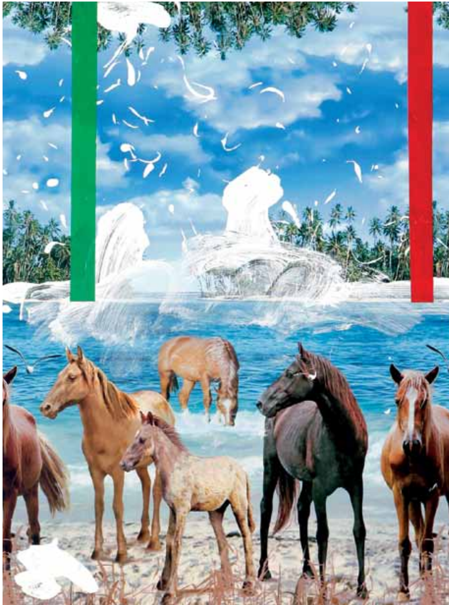
Wilde Horses , 2012 Acrylic on oilcloth 80 x 60 cm