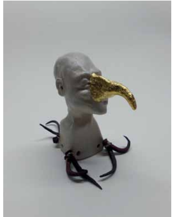
Untitled, 2012 Ceramics, wax, fabric, fur 7 x 51 x 12 cm