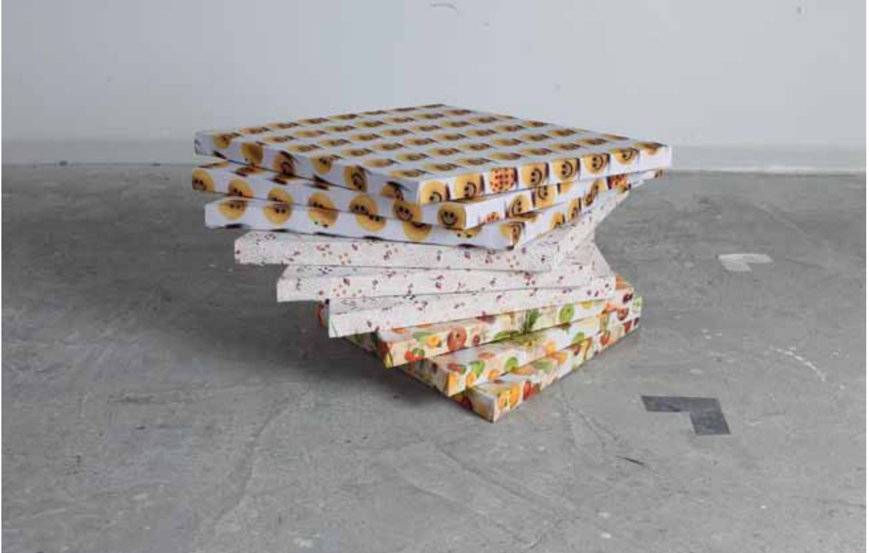
Smile Pile, 2012 Stretched textile 45 x 45 cm (each)