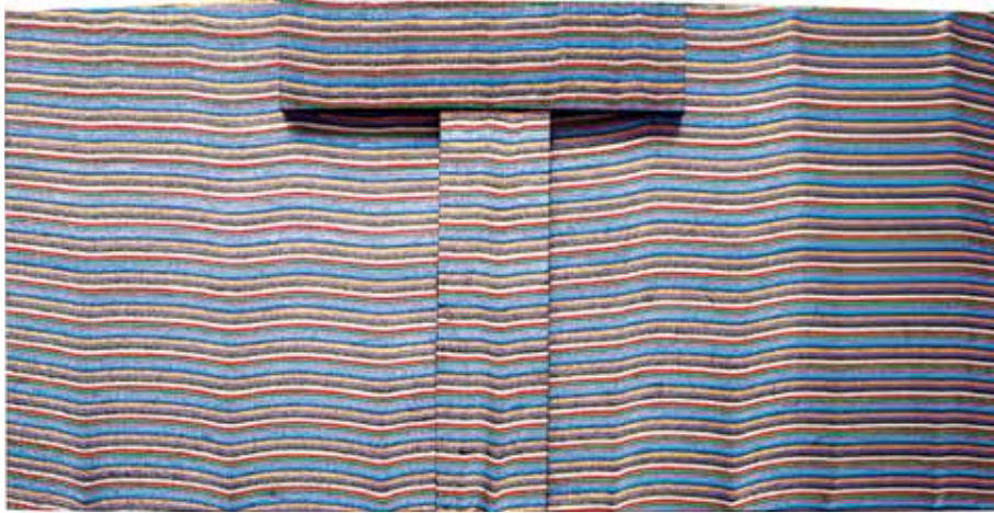
Testimony , 2014 Stretched textile 70 x 140 cm