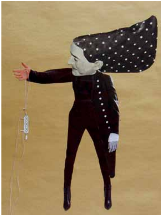
Untitled, 2012 Collage 30 x 24 cm